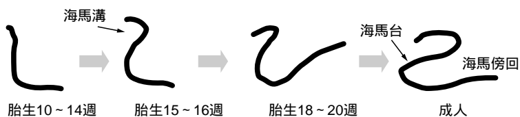
図2 海馬回旋の発達変化